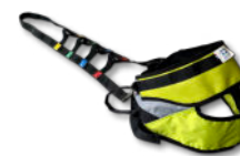
Système ISSEO® Réf : SYSSEO

Option pour un transfert sécurisé et un maintien en position debout