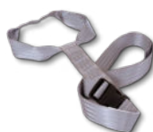
Sangle SANGO® Réf : SANGO