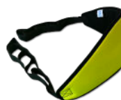
Sangle TCALEO® Réf : SYSTCALEO

Option pour un transfert sécurisé et un maintien en position debout