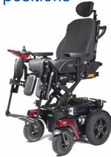
Lift électrique 35 cm

L'option « Élévation de l'assise » permet une intégration complète dans l'environnement et participe aux relations sociales.