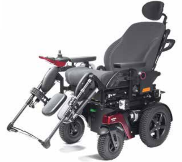
Assise inclinable à 45° et dossier inclinable à 30°

L'option « Élévation de l'assise » permet une intégration complète dans l'environnement et participe aux relations sociales.