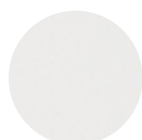
Blanc neige RAL 9016